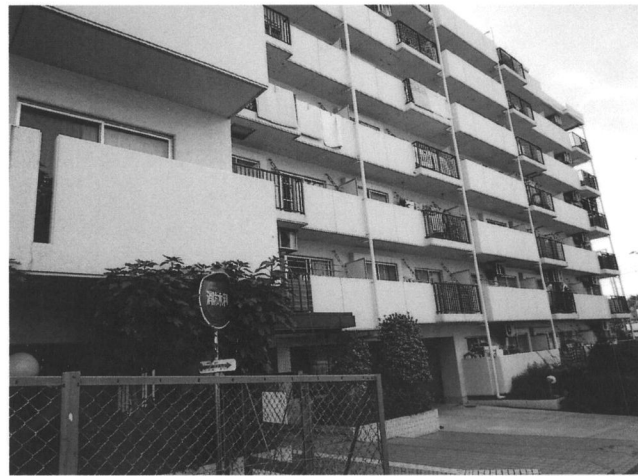
※図面と現況に相違がある場合は現況優先とします。