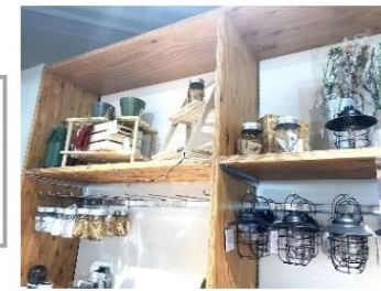
← カウンター下 造作可動棚