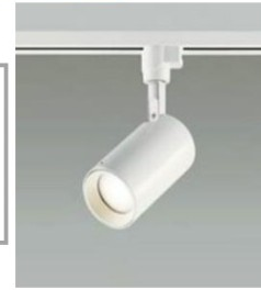
← ダクトレール スポットライト