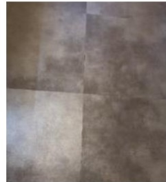
← 玄関床 フロアタイル