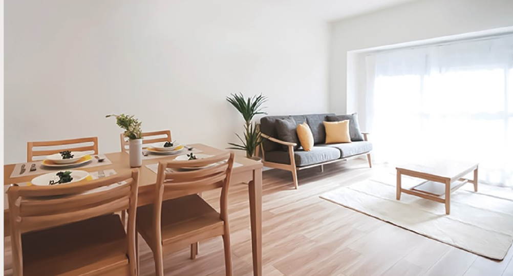
【イメージ写真】写真は一例ですので実際のものとは異なる場合があります。