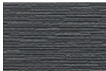
クレミナウォール調 リベルMGチャコール