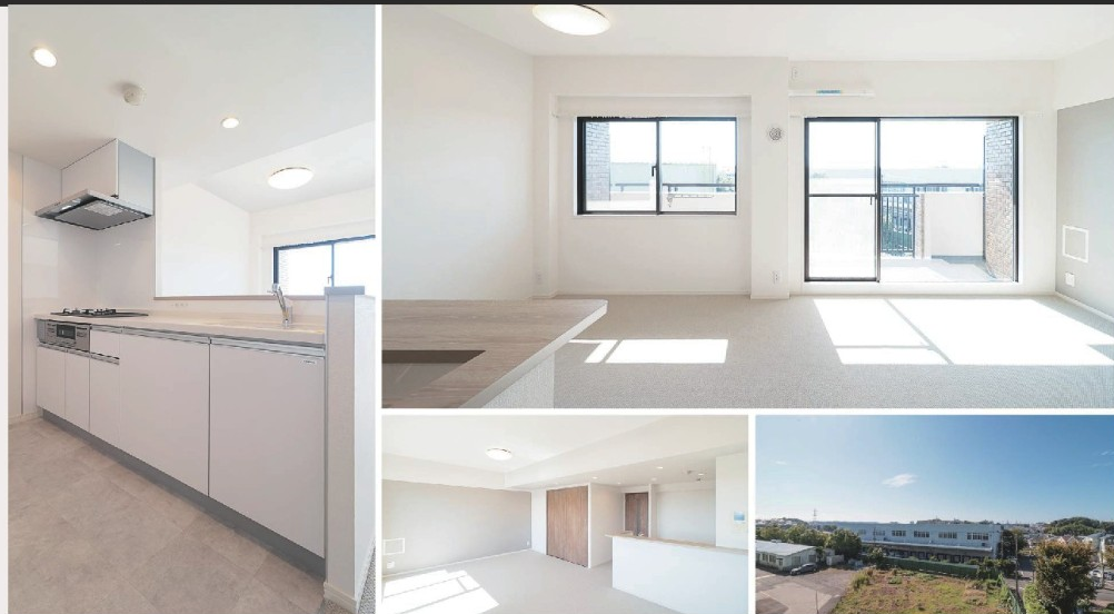
バルコニーからの眺望(2024年10月撮影)