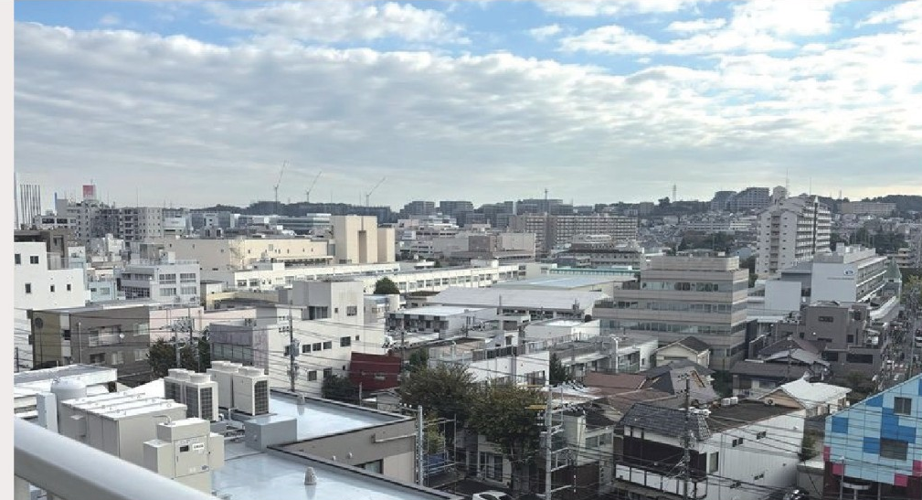
バルコニーからの眺望(2024年11月撮影)