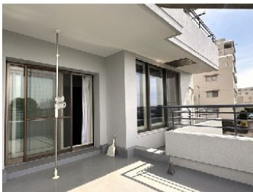
約21.45㎡のルーフバルコニー