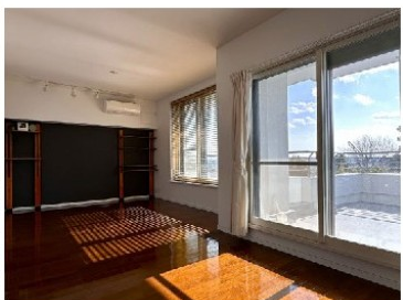
LDK約18帖(エコカラット設置)