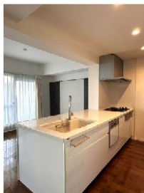
ペニンシュラキッチン