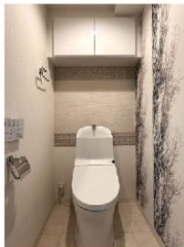
トイレ(エコカラット設置)