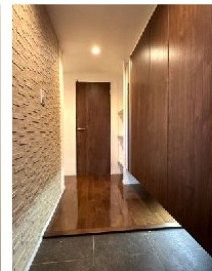
玄関(大容量シューズボックス)エコカラット設置