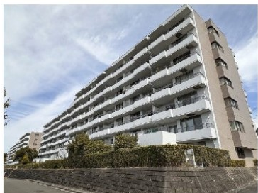
南西向きひな壇陽当り通風良好