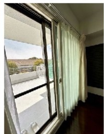
全窓2重サッシ(インプラス)